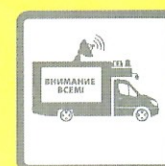
ПОДВИЖНЫЕ ЗВУКОУСИЛИТЕЛЬНЫЕ УСТАНОВКИ